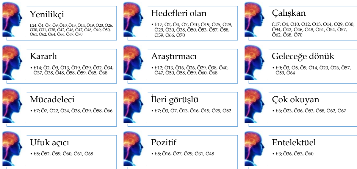
Şekil 1. İdealist öğretmenlerin bilişsel özellikleri ( f \geq 3 ).

İdealist öğretmenliğe ilişkin bilişsel özellikler alt temasında bulunan kodlar; yenilikçi ( f:24 ), hedefleri olan ( f:17 ), çalışkan ( f:17 ), kararlı ( f:14 ), araştırmacı ( f:12 ), geleceğe dönük ( f:9 ), ileri görüşlü ( f:7 ), mücadeleci ( f:7 ), çok okuyan ( f:6 ), ufuk açıcı ( f:5 ), pozitif ( f:5 ), entelektüel ( f:3 ), meraklı (Ö30, Ö32, Ö50), çağdaş (Ö7, Ö30, Ö47), hayalleri olan (Ö9, Ö21, Ö38), kuralları olan (Ö4, Ö21, Ö41), vizyoner (Ö10), zeki (Ö10), pratik (Ö52), risk alabilen (Ö3), yetenekli (Ö13), özgün (Ö42) şeklindedir.