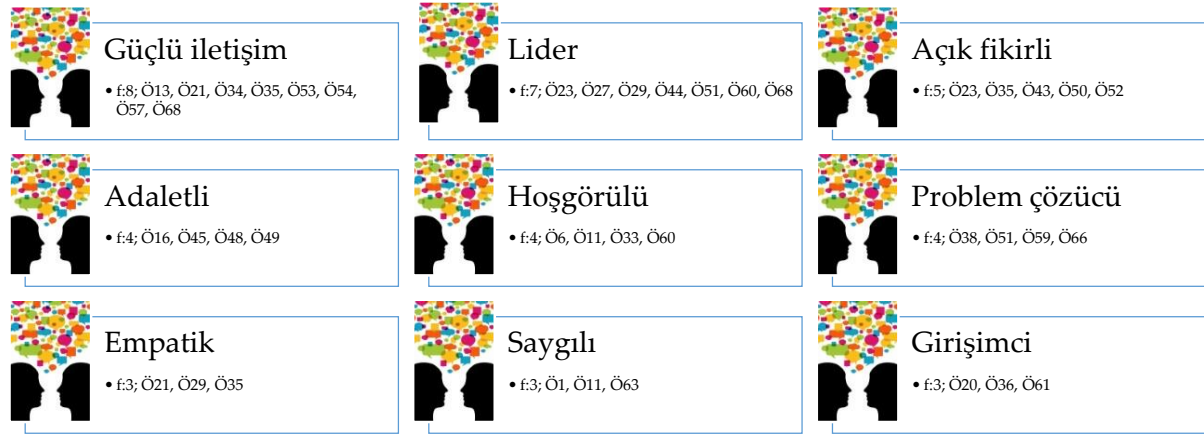
Şekil 2. İdealist öğretmenlerin sosyal özellikleri ( f \geq 3 ).

İdealist öğretmenliğe ilişkin sosyal özellikler alt temasında bulunan kodlar; güçlü iletişim ( f:8 ), lider ( f:7 ), açık fikirli ( f:5 ), adaletli ( f:4 ), hoşgörülü ( f:4 ), problem çözücü ( f:4 ), empatik ( f:3 ), girişimci ( f:3 ), saygılı ( f:3 ), yardımsever (Ö29, Ö49), takdir edilen (Ö26, Ö37), güler yüzlü (Ö69), güvenilir (Ö43), topluma yön veren (Ö65), fikirleri etkileyen (Ö65), sevecen (Ö4) şeklindedir.