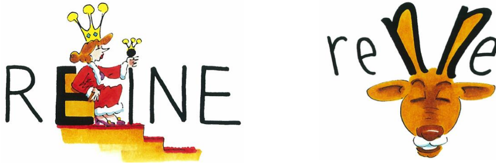
Şekil 1. « La reine » ve « Le renne » sözcüklerinin görsellerle yazımı (Valdois vd., 2003, s. 149-150).

Benzer bir biçimde Fransızcanın yazımını zorlaştıran başka bir konu da eşsesli sözcüklerdir. Kılavuzda sesletimi aynı olan (tanımlığıyla birlikte) kova: leseau:[so]; atlama: le saut:[so]; mühür: le sceau:[so]; aptal: le sot:[so] fakat farklı anlamlara sahip olan bu sözcüklere de yer verilmiştir. Yine, Fransızca kraliçe: la reine: [ʁɛn] ve ren geyiği: le renne: [ʁɛn] sözcüklerinin sesletimleri aynı (tanımlıkları farklı) ve yazımları birbirine yakındır. (Şekil 1) Bu tür sözcükler metin, diyalog ya da tümce içerisinde okunduğunda durumsal bağlam yorumu çerçevesinde kolaylıkla anlaşılabilen fakat Fransızca öğrenmeye yeni başlayanlar için dikte/yazma etkinliklerinde çoğunlukla yanlış biçimde yazılabilmektedir. Bu kılavuz sayesinde öğrenenler bu sözcükleri ve onların yazımlarını kolaylıkla öğrenirler.