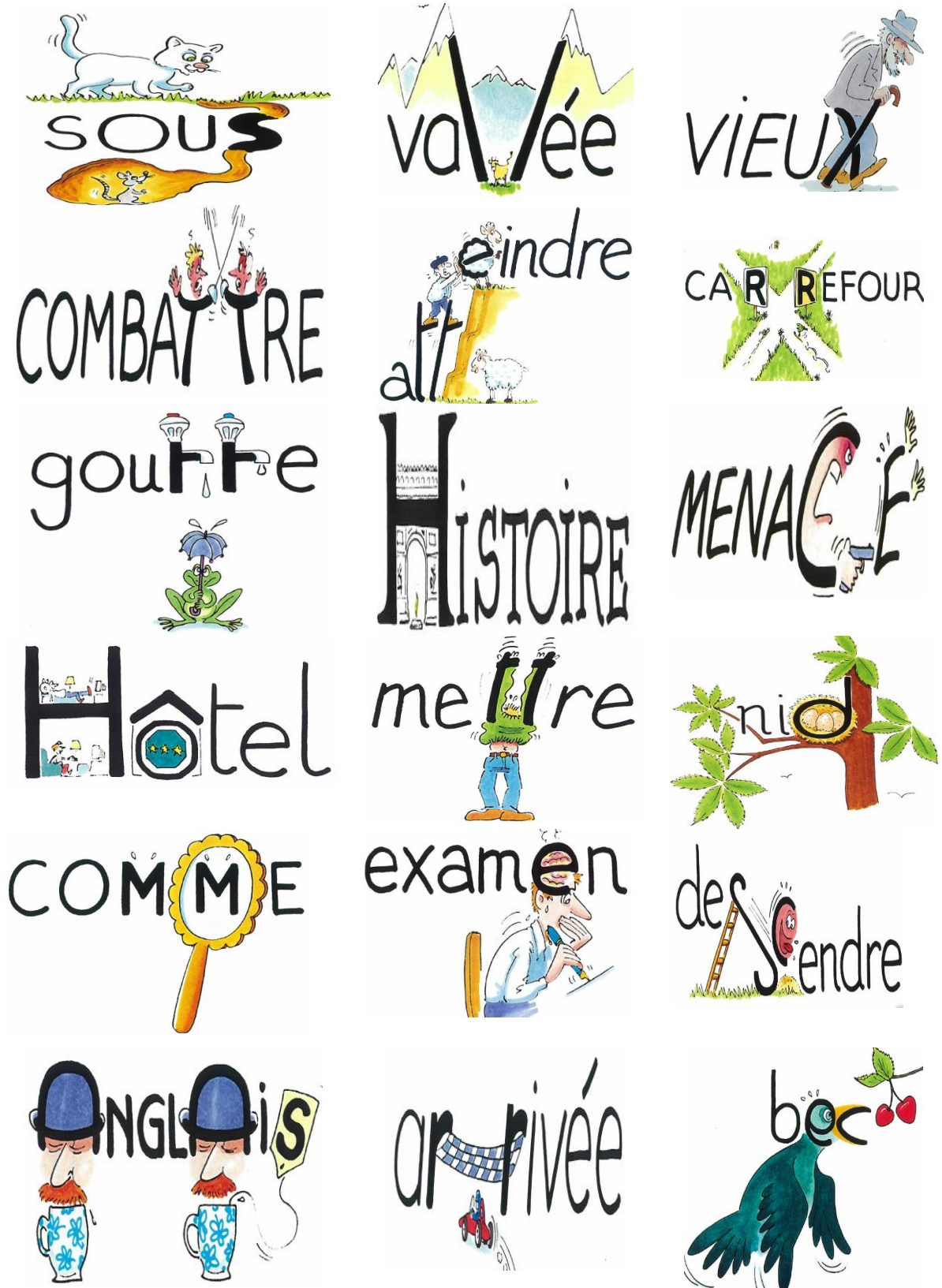
Şekil 3. Sözcüklerin görsellerle yazımına örnekler (Valdois vd., 2003, s. 66-192).